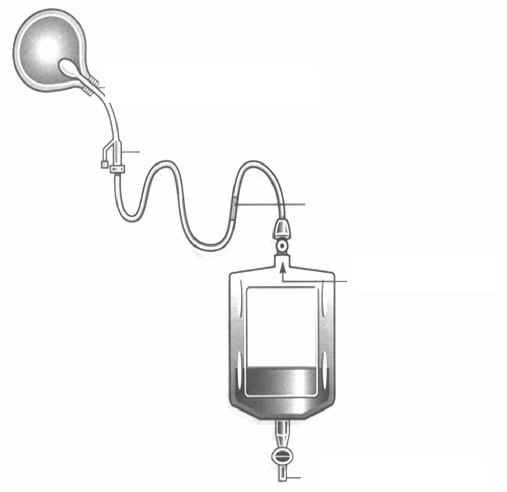
شکل رقم (٦)