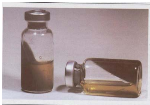
Trans isolate media ( TIM )